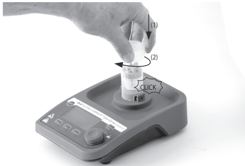
St-2 - Tube aufstecken • Put on the St-2 - Tube • Mettre le St-2 - Tube • Установка пробирки St-2

В соответствии с условиями продажи и поставки компании IKA® срок гарантии составляет 24 месяца. При наступлении гарантийного случая просим обращаться к продавцу или отправить прибор с приложением платежных документов и указанием причины рекламации непосредственно на наш завод. Расходы по перевозке берет на себя покупатель. Гарантия не распространяется на изнашивающиеся детали, случаи ненадлежащего обращения, недостаточного ухода и обслуживания, не соответствующего указаниям настоящей инструкции по эксплуатации.